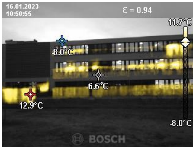
Im Vergleich Haus C