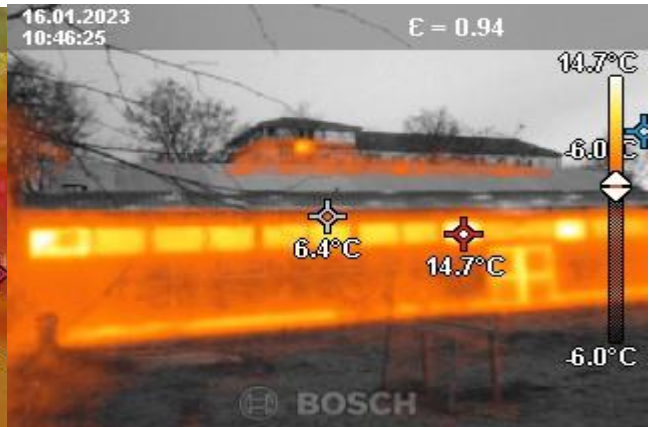
Turnhalle alt mit Wärmebildkamera